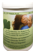
300 g Dose

MM-FIT POWER plus GINKGO fördert die Aktivität Ihres Organismus auf allen Ebenen durch natürliche Nährstoffe und Vitamine des biologischen Reiskorns plus Zink, Magnesium und Ginkgo für körperlich, seelische und geistige Gesundheit bis ins hohe Alter.