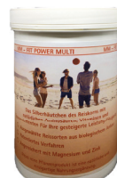
300 g Dose

Das 100 % biologisches Reishäutchen mit Keim angereichert angereichert mit 6000 mg Magnesium und 1800 mg Zink für mehr Ausdauer, Konzentration und Nervenkraft für körperliche und geistige Anforderungen.