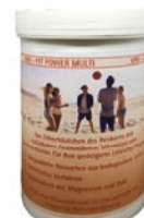
300 g Dose

Das 100 % biologisches Reishäutchen mit Keim angereichert angereichert mit 6000 mg Magnesium und 1800 mg Zink für mehr Ausdauer, Konzentration und Nervenkraft für körperliche und geistige Anforderungen.