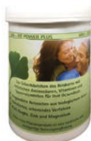
300 g Dose

MM-FIT POWER plus GINKGO fördert die Aktivität Ihres Organismus auf allen Ebenen durch natürliche Nährstoffe und Vitamine des biologischen Reiskorns plus Zink, Magnesium und Gingko für körperlich, seelische und geistige Gesundheit bis ins hohe Alter.